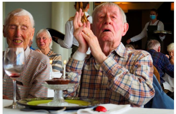
Impressionen vom Bewohnerausflug auf die Moosegg